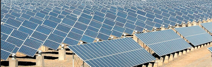
ظرفیت تولید نیروگاه‌های تجدیدپذیر تا پایان آذر به ۴۰۰۰ مگاوات می‌رسد

گزارش خبرنگار ما حاکیست، دولت به موازات برنامه‌ریزی برای استفاده از انرژی خورشیدی، به دنبال استفاده از سایر انرژی‌های پاک در تأمین برق نیز هست. یکی